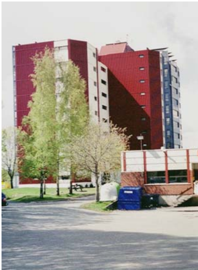
Figur 2.1: "Høyblokka" I

husholdninger på tre til fire personer, mens rundt 70 bestod av fem personer eller mer. 1 88% av husholdningene eide boligen selv (SSB 2003).