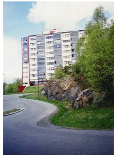
Figur 2.2: "Høyblokka" II