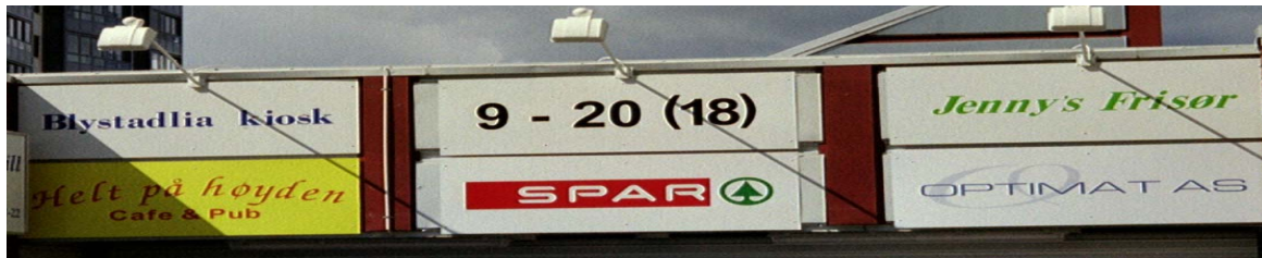
Figur 2.5: Skilt over inngangen til nærsenteret

såkalt "soveby". Størsteparten jobber innen ulike tjenestenæringer (85 prosent), mens resten stort sett jobber innen sekundærnæringene (SSB 2003).