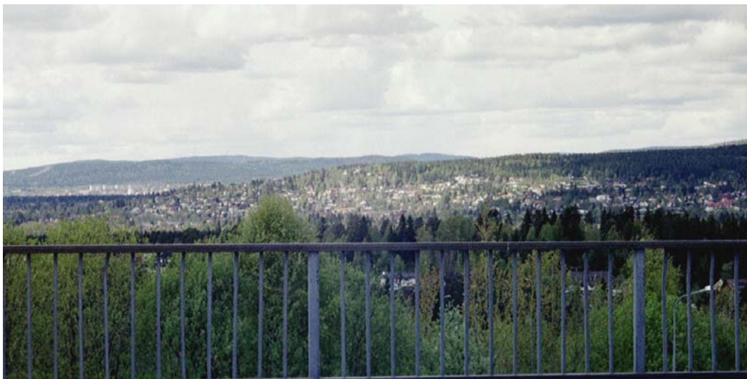
Figur 2.6: Utsikt fra bussholdeplassen

Det første som møter en når en går av bussen i Blystadlia er en stor, egentlig ganske trist boligblokk (kalt høyblokka) og nærsenteret. Rundt nærsenteret er det en del lavere blokker og terrasseblokker. Midt inne på området ligger det to barnehager, samt en barneskole, med mye skog, og fredelige omgivelser rundt. Marka er svært dominerende for stedet, og omkranser store deler av det. Opp mot grensa til marka ligger det flere ulike rekkehus og små eneboliger, som er godt vedlikeholdt, med trivelige, velstelte hager og tun rundt. Blystadlia ligger dessuten på en høyde, vest i Rælingsåsen, slik at man fra store deler av området har en flott utsikt. Og nettopp utsikten og det at Blystadlia ligger så tett opp til marka, med mange grønne lommer også inne på området, trekkes gjerne frem som spesielt attraktivt for stedet.