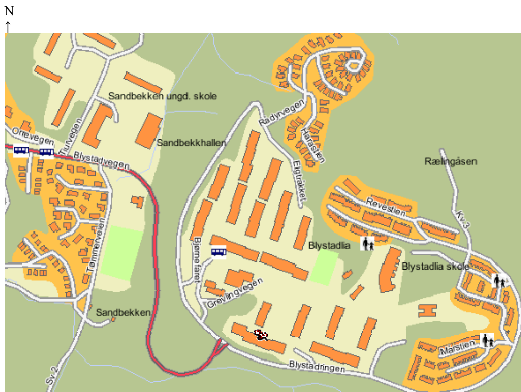
Kart 1.2: Blystadlia i forhold til omkringliggende områder i Rælingen kommune. Kilde: http://tux2.aftenposten.no/kart/ (02.08.05)