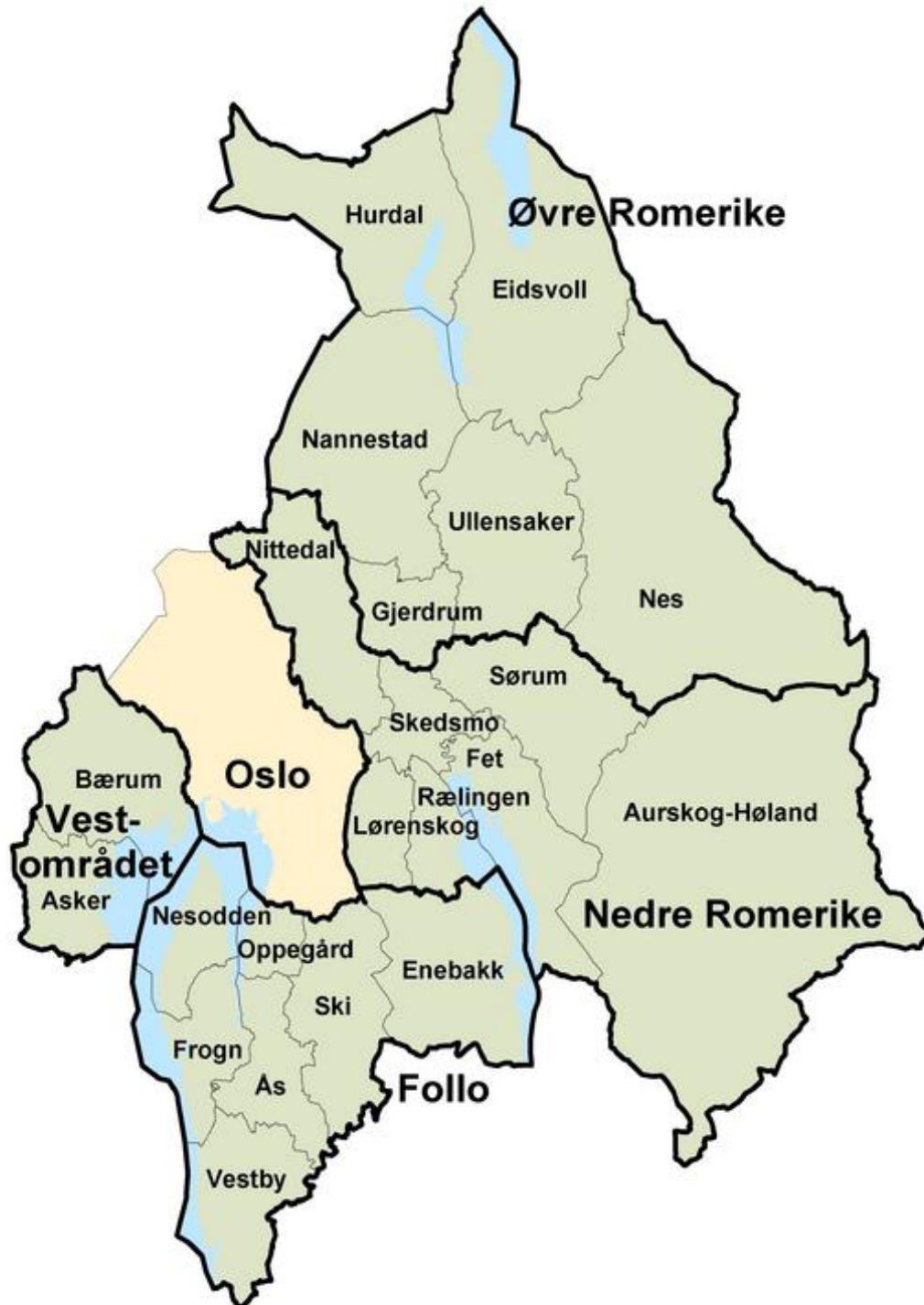
Kart 1.1: Akershus. (målestokk ikke tilgjengelig).