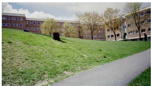
Figur 2.4: Noen av lavblokkene

Bebyggelsen i Blystadlia er godt skjermet fra trafikk, og det er ikke biltrafikk inne på området. Mye på grunn av dette er det derfor også et svært rolig område. Og det er godt lagt til rette for barnefamilier, med skole og barnehager liggende sentralt, og rikelig med lekeområder innimellom bebyggelsen. Ved bussholdeplassen finnes et nærsenter med en sparbutikk, en pub/kafé, kiosker og frisør. Flere lokaler stor imidlertid fortsatt tomme. I nærliggende lokaler finnes også andre tilbud, som blant annet tannlege og fysioterapeut.