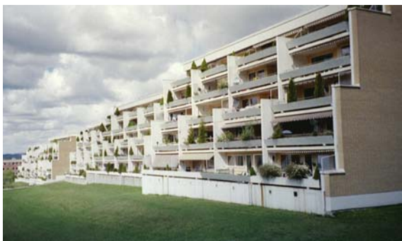
Figur 2.3: Noen av terrasseleilighetene