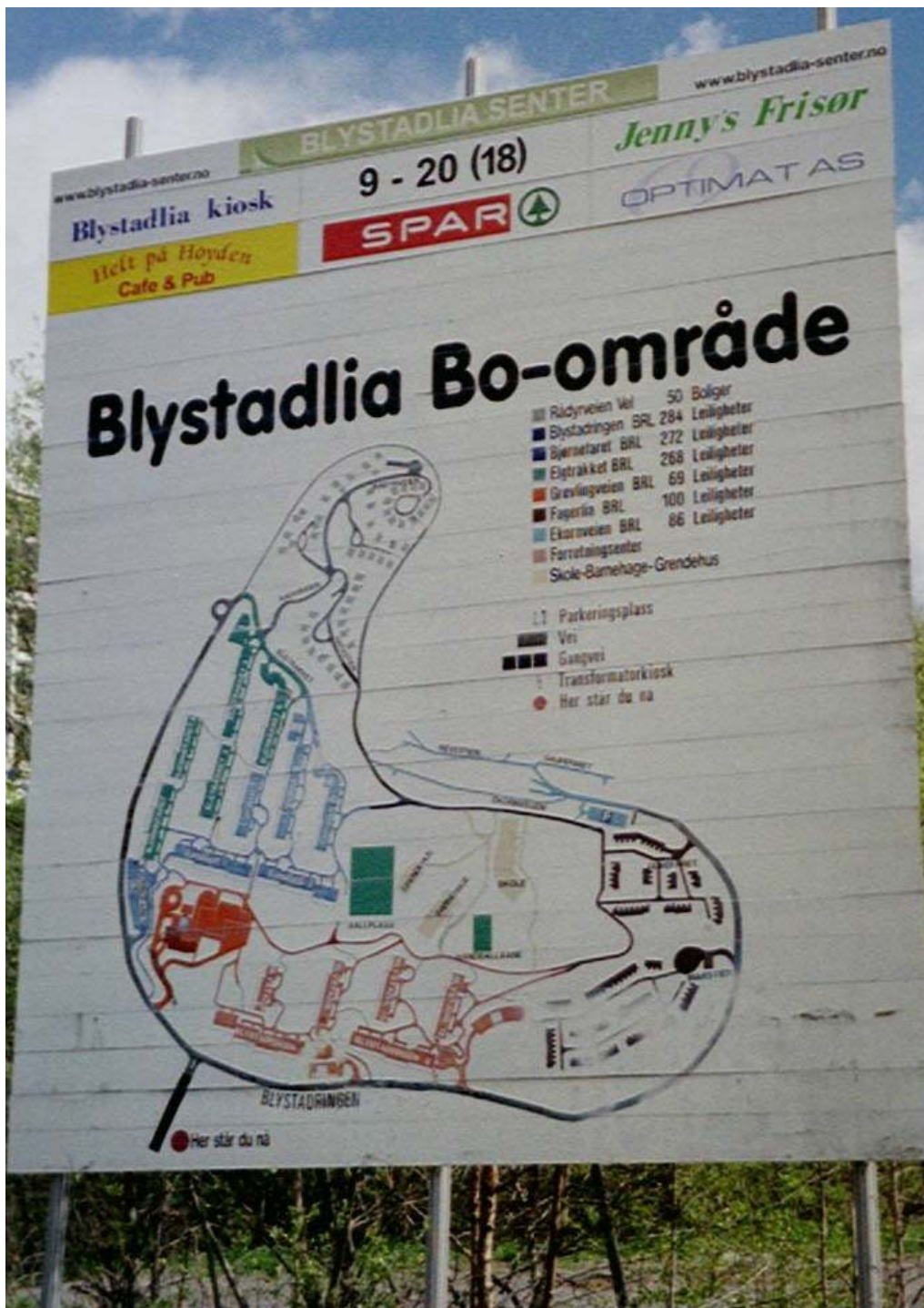
Figur 2.7: Skilt ved ankomst til Blystadlia.

Blystadlia vil ikke nødvendigvis falle inn under hvordan det er vanlig å definere en drabantby. Sosiologen Ivar Sekne (i Ellingsen 1994) har blant annet satt som kriterium at boligområdet må være i størrelsesorden ca 4000 mennesker eller mer, noe Blystadlia ikke innfrir. Men i det daglige er det likevel vanlig å omtale Blystadlia som en drabantby, og drabantbyer kan også defineres noe enklere, som "offentlig planlagte boområder i større byers ytre sone" (Kvarv 1995 i Grønli 2004:5).